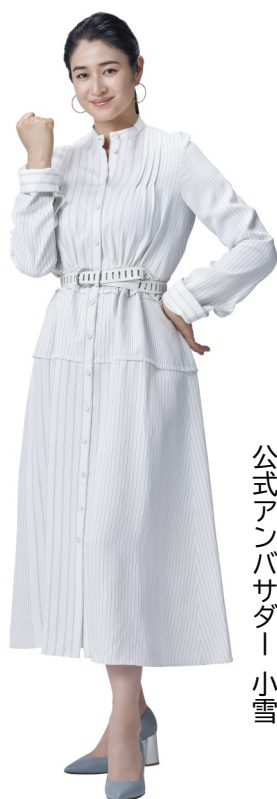
「中小企業からニッポンを元気にプロジェクト」 公式アンバサダー 小雪

オーナー様が所有する賃貸物件に設置されている「住宅設備機器の修理費用」と「退去時にかかる原状回復費用（オプション）」を保証する制度です。