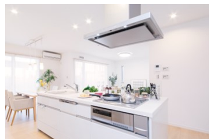
<住宅設備機器の修理>