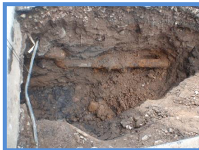
○埋設年数 : 38年 ○所在地 : 北海道