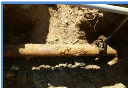
○埋設年数 : 40年 ○所在地 : 香川県