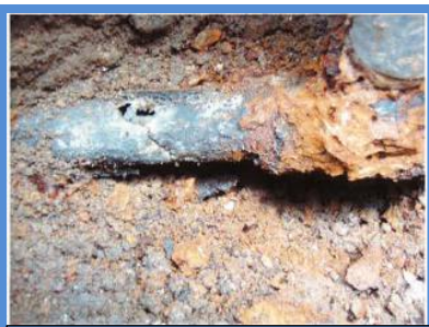
○埋設年数 : 41年 ○所在地 : 東京都