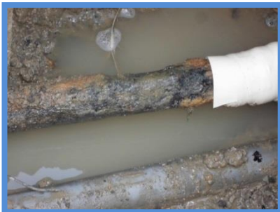
○埋設年数 : 45年 ○所在地 : 三重県