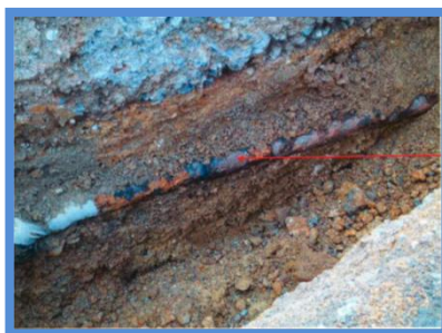
○埋設年数 : 41年 ○所在地 : 大阪府