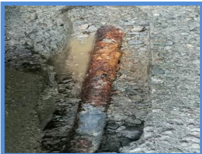
○埋設年数 : 40年 ○所在地 : 徳島県