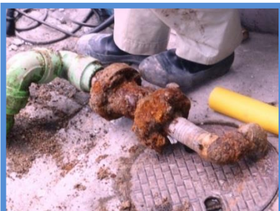
○埋設年数 : 50年 ○所在地 : 広島県