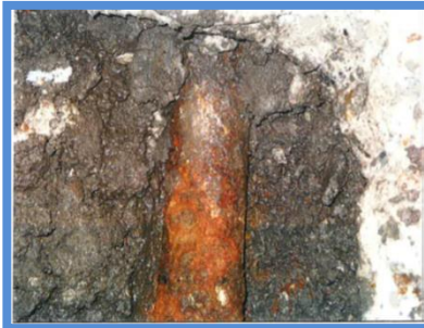
○埋設年数 : 43年 ○所在地 : 東京都